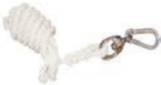
2M CUERDA C/ MOSQUETON BOMBERO COD:9260179

ALGODÓN 6M NEGRO C/ ESLAST COD:9260174 ALGODÓN 6M ROJO C/ESLAST COD:92601741 ALGODÓN 6M AZUL C/ESLAST COD:92601742 ALGODÓN 6M BLANCO C/ ESLAST COD:92601743 ALGODÓN 6M VERDE C/ESLAST COD:92601744