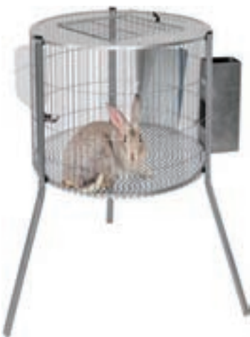
CILINDRO MACHOS MEDIDAS INTERIOR 70*94CM COMPLETA COD:9220005