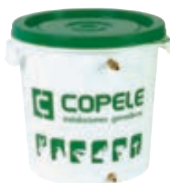
REGULADOR PRESION DE AGUA 30L COD:9220070