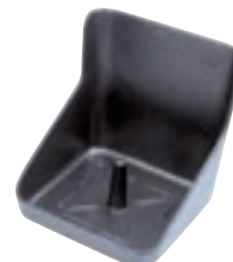
SOPORTE PIEDRA SAL PLASTICO (23*21,5*21) COD:9220333