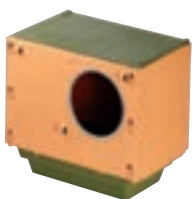
NIDO PENTA MATERNIDAD MEDIDAS 40*26*37CM COD:9220085