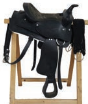
TEJANA PONY 12" MOD. WESTERN COD:9260522