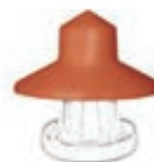
CUBRE TOLVAS PLASTICO 10KG COD:9220109 CAJA 5 UND