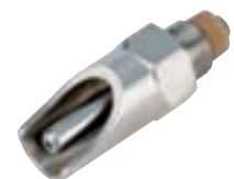
BEBEDERO CERDOS C/PROTECTOR COD:9220235