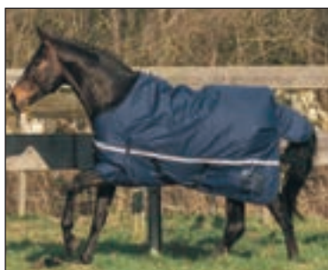
MANTA IMPERMEABLE CUADROS C/FUELLE COD:9260130