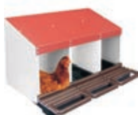
PONEDERO 3DPTO 80*50*43.5CM COD:9220210