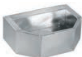
COMEDERO PARED (50*36*20,5) COD:9220310