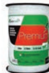
CINTA PASTOR 200M BLANCA DIAMETRO 2 (6*012)COD:9260616