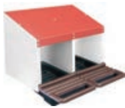
PONEDERO 2DPTO 53*50*43.5CM COD:9220211