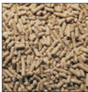
A-00 POLLOS INICIACION SACO 25KG COD:9201100