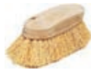
CEPILLO PLASTICO CERDA SINTETICA COD:9260229