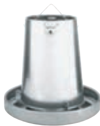
TOLVA COLGANTE METAL 33*41CM 10KG COD:9220110 CAJA 5 UND