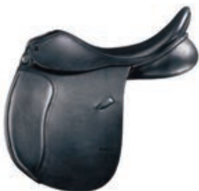
INGLESA NEGRA COMPLETA COD:9260500