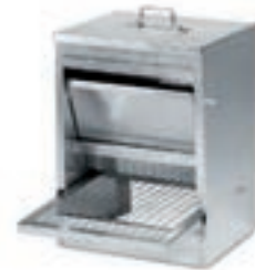
TOLVA METALICA AVES APERTURA MECANICA 10KG (30*45*41) COD:9220111 20KG (48*46*45 ) COD:9220107