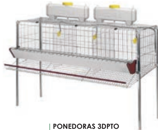
PONEDORAS 3DPTO 120*71*106CM COD:9220201