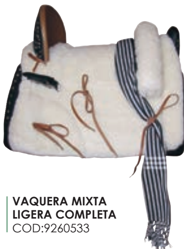
VAQUERA MIXTA LIGERA COMPLETA COD:9260533