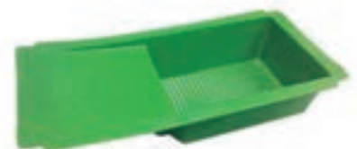
CUBETA FONDO NIDO C/BANDEJA MEDIDAS 50*24.5*9CM COD:9220078