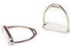
INGLES CROMADO C/ TACO 12CM COD:9260335