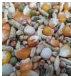
GALLO INGLES MANTENIMIENTO SACO 25KG COD:9008520