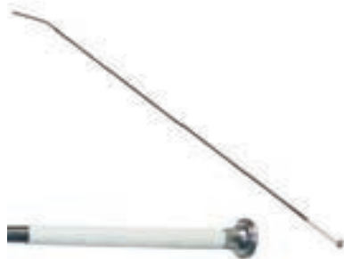
DOMA 120CM COD:9260302