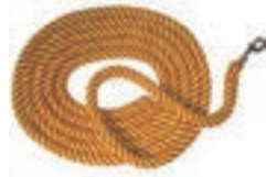
NYLON 2M COLOR SURTIDO COD:9260180