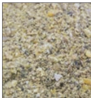
PONEDORAS FASE ORO HARINA SACO 25KG COD:9202100