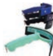
LIMPIASUDOR MEDIA LUNA PLASTICO COD:9260252