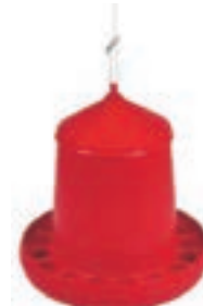
TOLVA AVES PLASTICO 2KG (24*24) - COD:9220118 4KG (30*30) - COD:9220116 8KG (37*37) - COD:9220113 CAJA 5 UND