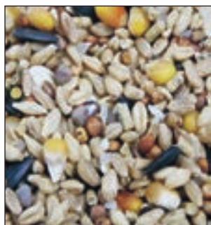
GALLO INGLES CRIA Y MUDA SACO 25KG COD:9008510