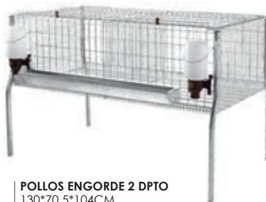
POLLOS ENGORDE 2 DPTO 130*70.5*104CM COD:9220242