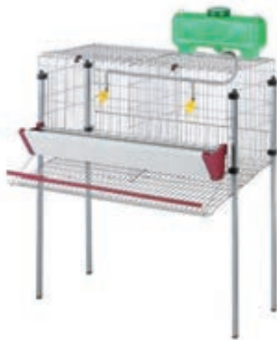
PONEDORAS 2DPTO 80*71*106CM COD:9220200