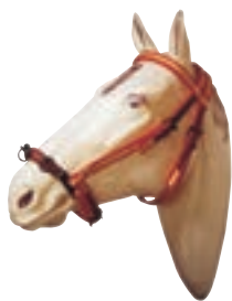
NYLON SERRETA EQ 3 PILARES COD:9260044