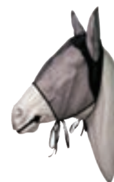
MÁSCARA ANTIMOSCAS CON OREJERAS CABALLOS COD:9260880