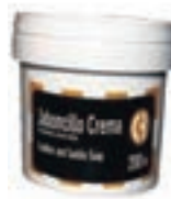
JABONCILLO CREMA 200GR COD:9240842 CAJA 25 UND