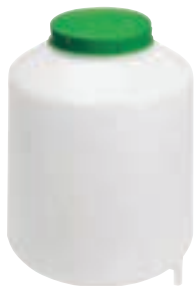
8 LITROS CON FILTRO COD:9220049 CAJA 4 UND