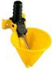
BEBEDERO POLLOS M-73 COD:9220057 CAJA 25 UND