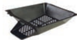
CUBETA PONEDERO 26*34*12CM COD:9220212