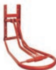
PORTA MONTURAS PLEGABLE COD:9220325