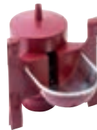
BEBEDERO CONEJOS BOYA MIXTO COD:9220036 CAJA 10 UND