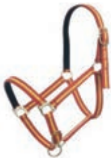
NYLON DOBLE POTRO SURTIDA COD:9260028