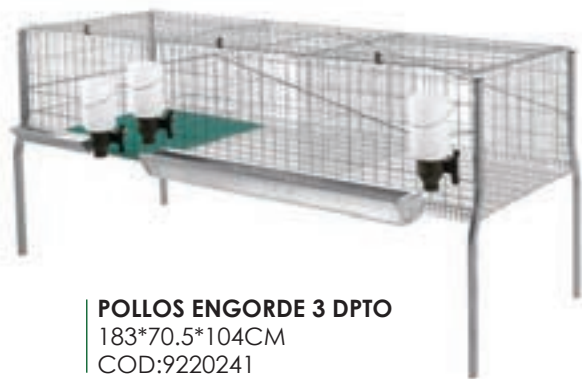
POLLOS ENGORDE 3 DPTO 183*70.5*104CM COD:9220241