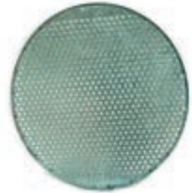
SUELO CILINDRO MACHOS CHAPA MEDIDAS 67*67*20 CM COD:9220152