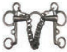
PELHAM PUENTE GRUESO INOX 12.5 CM COD:9260736