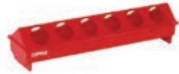
BEBEDERO POLLOS 50 CM PLASTICO COD:9220122 CAJA 12 UND