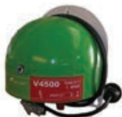
PASTOR ELECTRICO V 4.500 - 230V COD:9260601