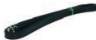
ACCION DE ESTRIBO INGLESA 25MM COD:9260300