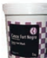
CASCO FORT 1KG COD:9240815 CAJA 12 UND