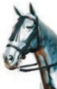
VAQUERA C/AHOGADERO NEGRA COD:9260060