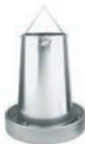
TOLVA COLGANTE METAL 40*46CM 20KG COD:9220112 CAJA 5 UND