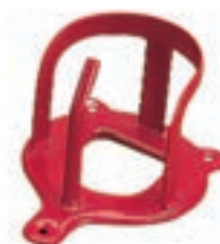
PORTA BRIDAS PARED COD:9220327