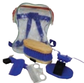
KIT DE LIMPIEZA EURIMEX HORSE COD:9260860