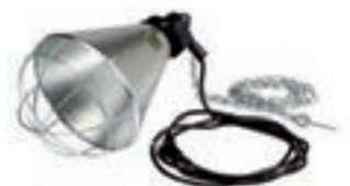
PORTA-LAMPARAS C/PROTECTOR COD:9220225