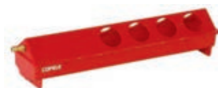
BEBEDERO POLLOS 50CM AUTOMATICO PLASTICO COD:9220123 CAJA 8 UND