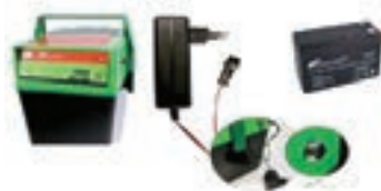
KIT PASTOR ELECTRICO 1000 - 9/12V COD:9260602