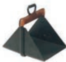
VAQ.MEDIA CAÑA FORRADO EDUBE COD:9260298