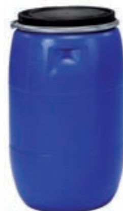
120 LITROS COD:9220385