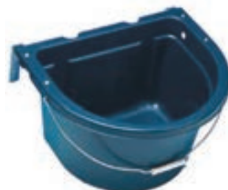
COMEDERO PORTATIL C/ASA (39*32*28) COD:9260852