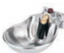
BEBEDERO CABALLOS C/EMPUJADOR (22*28*18) COD:9220302 CAJA 2 UND