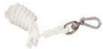
7M CUERDA C/ MOSQUETON BOMBERO COD:9260187