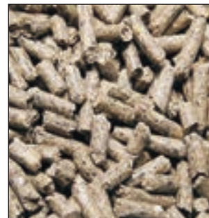
CONEJOS LAPIPLUS SACO 25KG COD:9204200