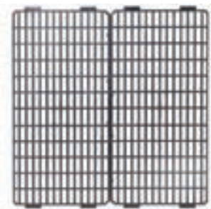
SUELO PLASTICO CONEJERA MEDIDAS 61*50CM COD:9220151 CAJA 5 UND