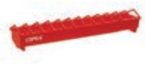
COMEDERO POLLOS 1.ª EDAD PLASTICO 40CM COD:9220120 CAJA 12 UND 80CM COD:9220121 CAJA 6 UND