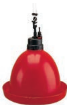
BEBEDERO POLLOS COLGANTE AUTOMATICO (35*36CM) COD:9220072 CAJA 2 UND