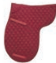
SUDADERO INGLESA ALGODÓN ACOLCHADO COD:9260144