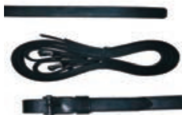
FALSA RIENDA VAQUERA COD:9260712