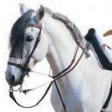
GAMARRA VAQUERA COD:9260719