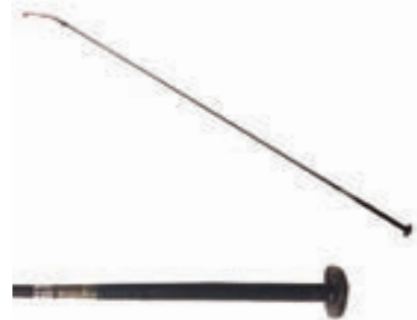
PICADERO 180CM COD:9260289