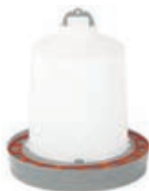
ARILLO SALVA-POLLUELOS 31CM COD:9220066 CAJA 5 UND