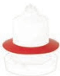
ANILLO PROTECTOR BEBEDERO POLLOS 33CM COD:9220067 CAJA 5 UND