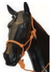
CUADRA NYLON NUDOS C/ RAMAL BANDERA ESPAÑOLA COD:9260040