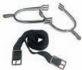
INGLESA GALLO CORTO CON RULETA COD:9260313