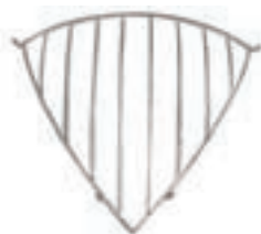
FORRAJERA ESQUINA (87,5*60) COD:9220322