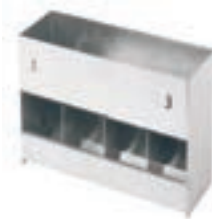
TOLVILLA 4 HUECOS COD:9220106 (30*14*32)