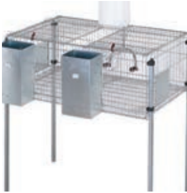
PENTA 2 - PLASTICO CONEJOS 105*62*99*99CM COMPLETA COD:9220008