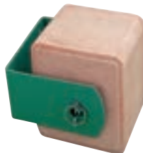
SOPORTE PIEDRA SAL (24*20,5*10) COD:9220332