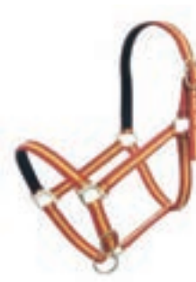
NYLON DOBLE PONY BANDERA ESPAÑOLA COD:9260033