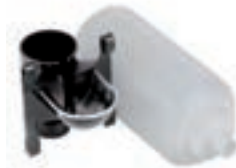
BEBEDERO CONEJOS MIXTO C/BOTELLA - COD:9220037 S/BOTELLA - COD:9220030 CAJA 10 UND