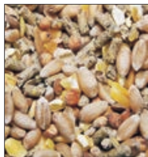
AVES DE CORRAL SACO 25KG - COD:9008100 BOLSA 25 KG - COD:9050580