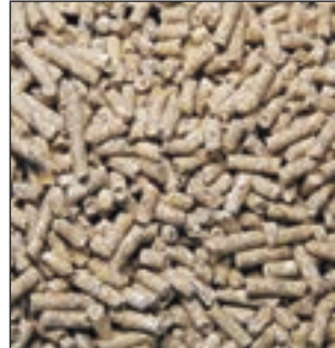
A-12 POLLOS CRECIMIENTO SACO 25KG COD:9201310