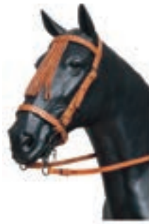
VAQUERA C/AHOGADERO MARRÓN COD:9260061