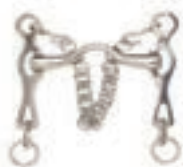
PORTUGUES EMBOCADURA LISA INOX.12.5 CM COD:9260733