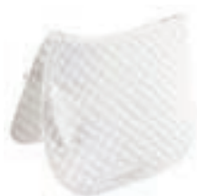
MANTILLA INGLESA G WICMOEL COD:9260100