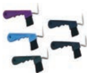
LIMPIACASCOS C/CEPILLO COD:9260230