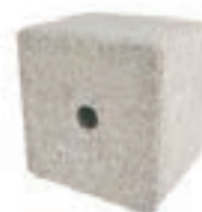
BLOQUE MINERAL 10KG COD:9206150 CAJA 10 UND