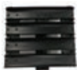
RASQUETA METAL COD:9260220 CAJA 10 UND