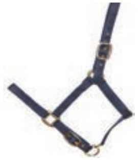
CUADRA NYLON DOBLE PONY COD:9260040