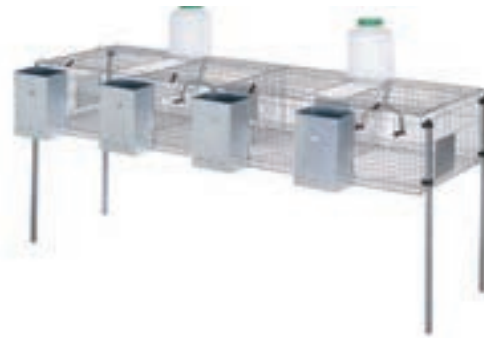
PENTA 4 - PLASTICO CONEJOS 206*62*99CM COMPLETA COD:9220009