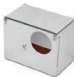
NIDO CONEJOS EXT INDUSTRIAL C/TAPA COD:9220080