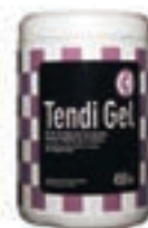
TENDI-GEL 450GR COD:9240848