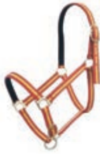
NYLON DOBLE FULL COD:9260030