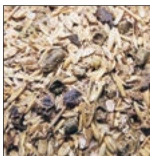
CABALLOS DE RECREO SACO 30KG COD:9008300