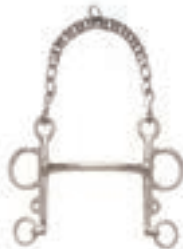
PELHAM RECTO GRUESO INOX 12.5 CM COD:9260737