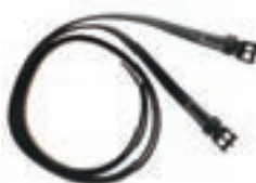
ESPUELA VQ. NEGRA COD:9260325