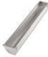
COMEDERO BATERÍA PONEDORAS 9 PLAZAS COD:9220312