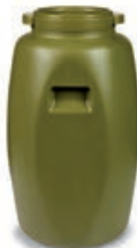
60 LITROS COD:9220380