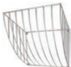
FORRAJERA FRONTAL (79*50*55) COD:9220320