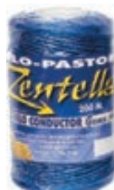
HILO PASTOR 200M NARANJA DIAMETRO 2 (6*0,16) COD:9260611