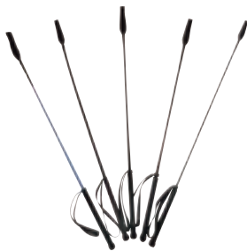
GENERAL 65CM COD:9260280