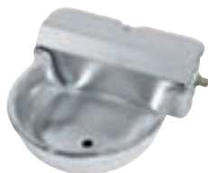
BEBEDERO CABALLOS GRANDE (27*33*15) COD:9220301 CAJA 2 UND