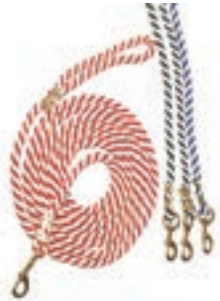
NYLON 6M C/MOSQUETON COD:9260168