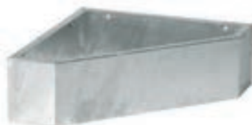
COMEDERO ESQUINA (48,5*20) COD:9220311