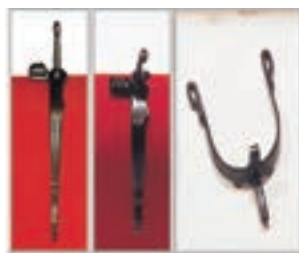
VAQUERA FORJA PAVO GALLO R. RULETA COD:9260312