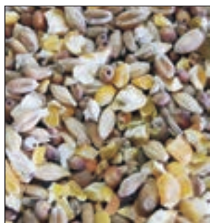
GALLINAS DE CORRAL SACO 25KG COD:9008150