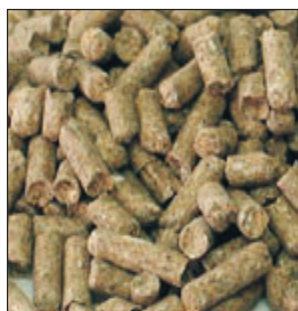
E-30 ALTA ENERGIA CABALLOS SACO 25KG COD:9206100