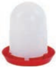
BEBEDERO POLLOS 2L - COD:9220050 5L - COD:9220052 8L - COD:9220051 12L - COD:9220046 CAJA 5 UND