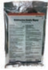
OXITETRACICLINA SOLUBLE 100GR COD:9240790