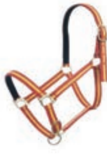
NYLON DOBLE COB COD:9260031