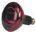
INFRARROJA 150W COD:9220227.