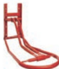
PORTA SILLAS PLEGABLE PARED BASE ANCHA COD:9260895