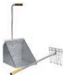
RECOGEDOR ESTIERCOL C/RASTRILLO - COD:9220330 S/RASTRILLO - COD:9220331