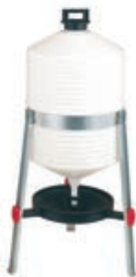
BEBEDERO C/PATAS AVES 30L COD:9220041 MEDIDAS 40X75CM