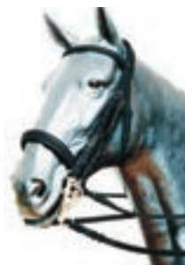
INGLESA CUERO FULLNEGRO COD:9260067