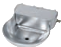
BEBEDERO CABALLOS (22*30*12) COD:9220300 CAJA 2 UND