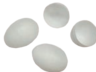
HUEVOS GALLINAS PARA INCUBACIÓN COD:9220087 5 UND COD:9220089