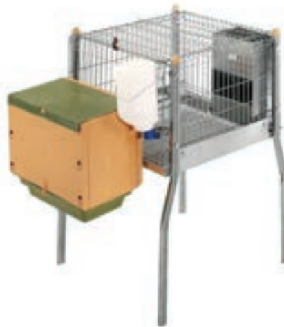
JAULA CONEJOS INDIVIDUAL C/ PATAS C/NIDO COD:9364102