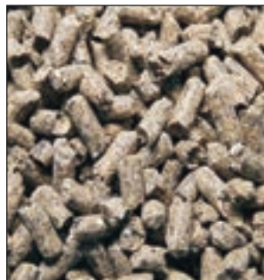
CONEJOS CUNI FAMILIAR SACO 25KG COD:9204100