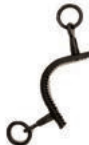
MUSEROLA TORNO PILAR CORTO PAVONADO COD:9260753