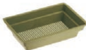
CUBETA FONDO NIDO MEDIDAS 39*25*8CM COD:9220075