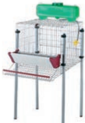
PONEDORAS 1DPTO 40*71*106CM COD:9220203