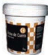
GRASA CUERO 1KG COD:9240835 450GR COD:9240837 CAJA 12 UND