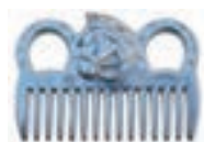
PEINE ALUMINIO COD:9260245