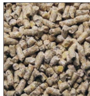
A-72 AVES CRIA Y REPRODUCTORAS SACO 25KG COD:9207300